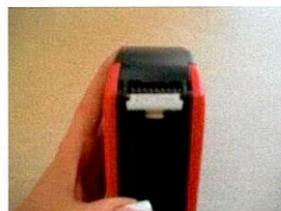
Etikett wird gedruckt und gespendet