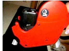
gespendetes Etikett auf der Ware abrollen