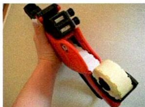
Setzen Sie die Etikettenrolle auf die Halterung im Deckel und lassen Sie den Etikettenstreifen durch das Gerät fallen