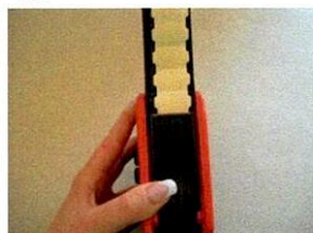
Innerer Klappboden zudrücken