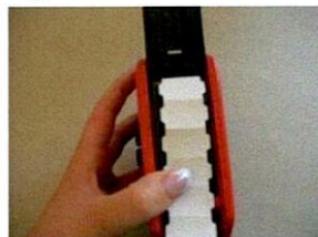
Legen Sie das Ende des Etikettenstreifens um den inneren Klappboden herum