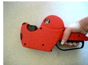
Handgriff drücken.....und lösen