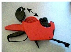
Öffnen Sie den Etikettenrollen-Halter und BEIDE Klappböden