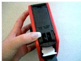
Nun können Sie auch den äußeren Klappboden zudrücken