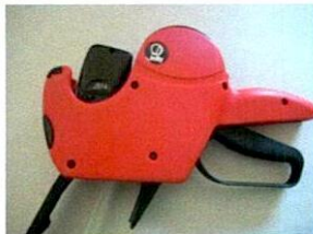
Nun können Sie den Etikettenrollen-Halter zudrücken