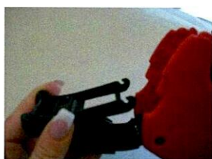
...alte Farbrolle entfernen und neue einsetzen

Der Auszeichner Jolly besitzt ein verstellbares Druckwerk, d.h. Sie können je nach Bedarf den Druck nach unten oder nach oben verschieben. Lösen sie hierzu einfach die Schrauben auf beiden Seiten des Druckwerks und verschieben Sie ihn nach Wunsch.