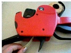
Ziehen Sie den Etikettenstreifen ca. 10 cm. aus dem unteren Gerätebereich